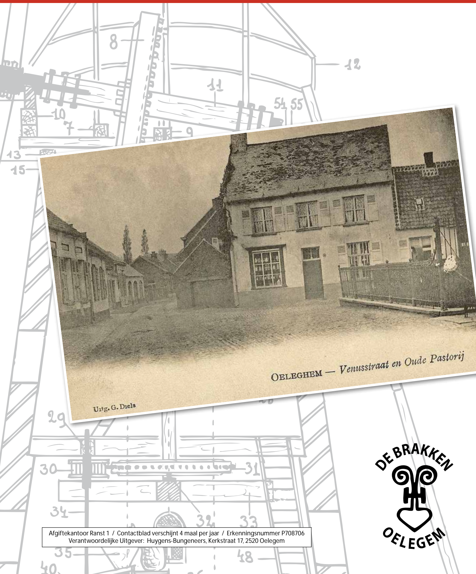
OELEGHEM — Venusstraat en Oude Pastorie