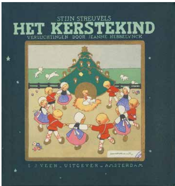
Cover van de vijfde uitgave (1937) met tekeningen door Jeanne Hebbelynck. Antwerpen, Letterenhuis

Bundel S 395/350 heeft als identificatie WO II – Brieven van soldaten en bevat 41 stukken, geschreven in de periode tussen september 1939 en maart 1940. Verschillende van deze brieven en kaartjes wijzen er op dat Stijn Streuvels op het einde van 1939 een exemplaar van zijn novelle Het Kerstkind liet bezorgen aan gemobiliseerde dorpsgenoten.