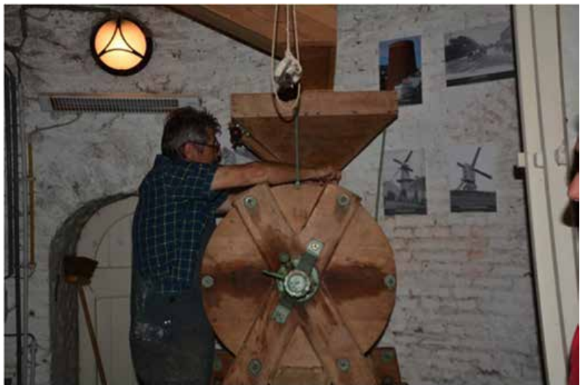
Op de foto linksboven het scherpen van de steen, rechts het monterwerk. Op de onderste foto zie je op de achtergrond een deel van het molenpanorama.