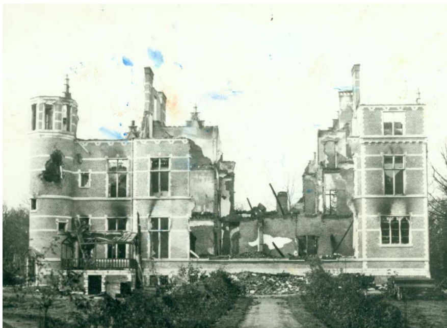
Het uitgebrande kasteel.

Op woensdag 7 oktober 1914, rond acht uur 's morgens, meldde een onderluitenant van de Belgische Genietroepen zich op het Vrieselhof aan met de boodschap: 'Ik heb bevel om 12 uur het kasteel in brand te steken.' De heer des huizes was toen in zijn ambtswoning in de stad en de boswachter snelde vierkluwens naar Antwerpen om zijn baas op de hoogte te brengen. Die kwam pas rond halftwaalf op het kasteel toe, om vast te stellen dat de keukenmeid alles wat voor haar waardevol was, heel plichtsbewust buiten op het gras had gelegd: potten, pannen en het volledige keukengerei... maar geen wandtapijten, meubels of waardevolle schilderijen. Stipt om twaalf uur hebben de Belgische troepen het kasteel – nagenoeg met volledige inhoud – in brand gestoken!