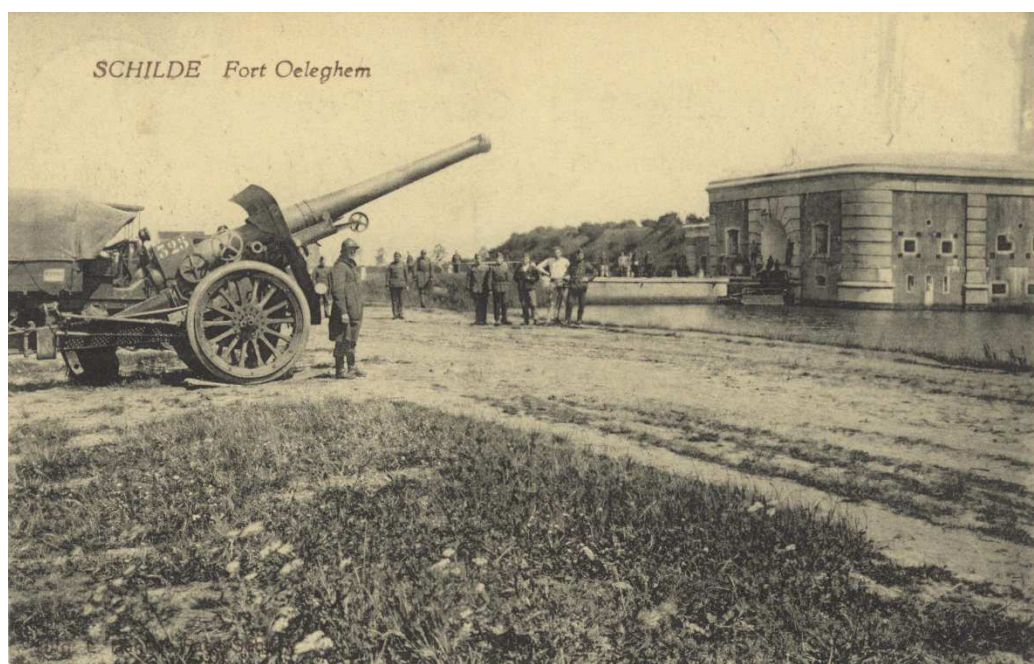
Postkaart van fort Oelegem. Privécollectie