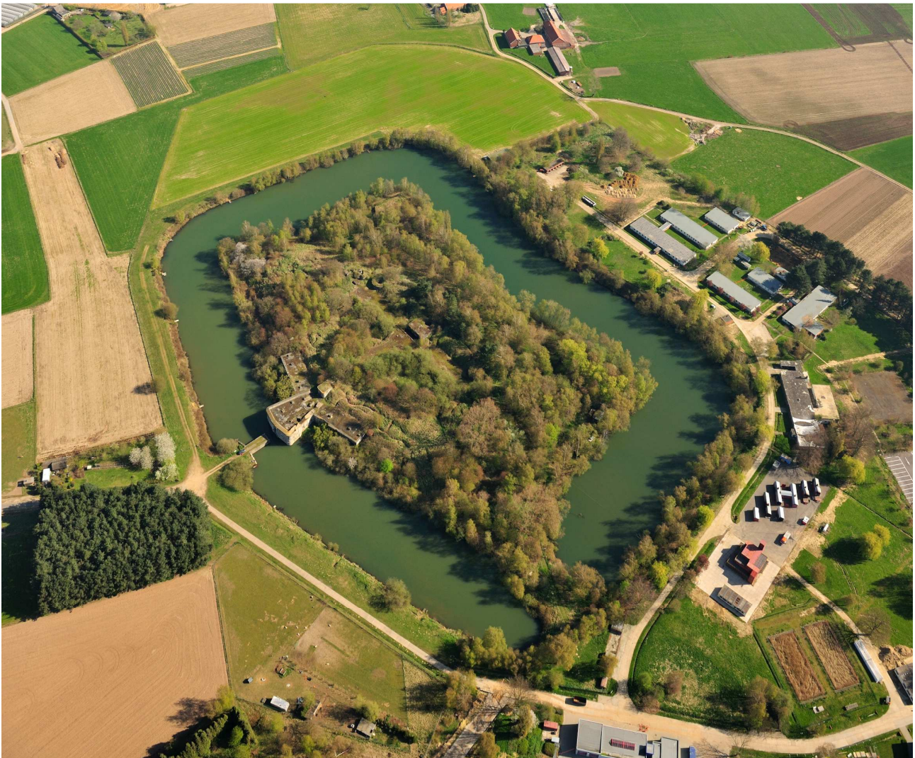
Luchtfoto van fort Broechem, met op de voorgrond Campus Vesta.